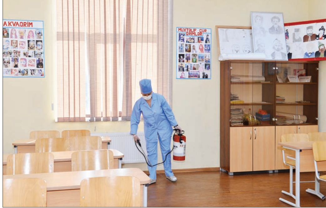
Martın 4-də bu işlə əlaqədar olan qurumun nümayəndələri paytaxtın Buzovna qəsəbəsində yerləşən 5 nömrəli Bakı Peşə Məktəbində dezinfeksiya işləri aparıb. Proses media nü-